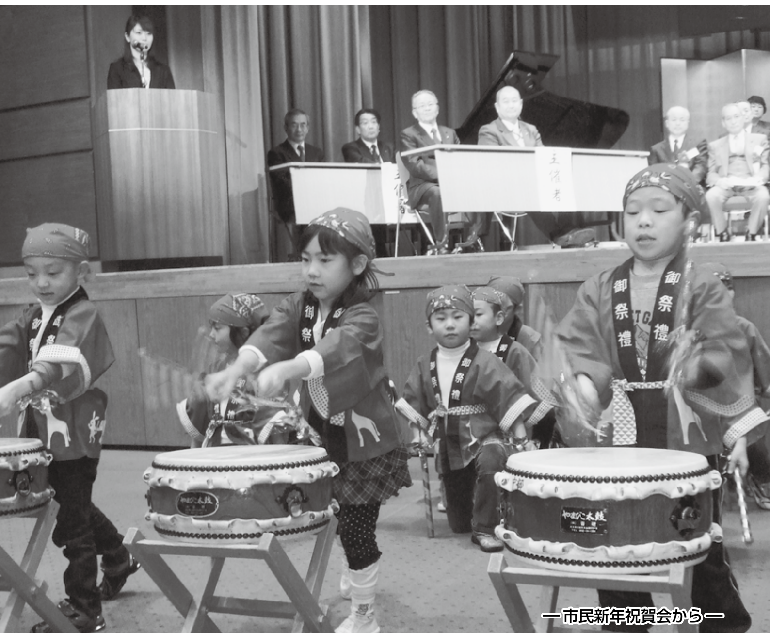
—市民新年祝賀会から—