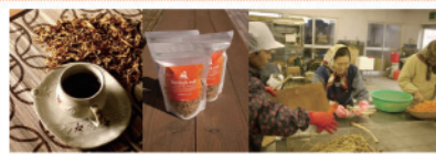
「青森ごぼう茶」主体：株式会社 Growth 地域：青森県三沢市大町 概要：大衆に親しまれていた規格外のごぼうをお茶に加工。手作業で手間をかけてつくることこだわり、付加価値を生み出す