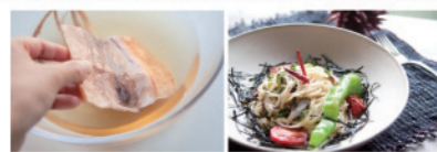
「ドライフードラボ」主体：一般社団法人Maru協会 概要：ドライフードの良さを現代風にアレンジしてPR。流通コストの低いドライフードを普及させることで、漁業の新しい可能性を追求している。