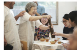
【間違える】→【人間らしい】【寛容さ】などにポジティブ変換 概要：ホールで働く従業員はみんな認知症の方々。 「こっちはおいしそうだし、ま、いっか」。おらかな気分が広がる。