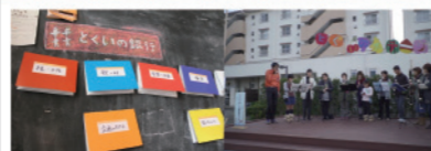
「とくいの銀行」頭取：深澤 孝史（美術家） 場所：茨城県取手市井野団地 概要：住民の「とくい」などを集め、交換できる仕組み。みんなの「とくい」を合わせてイベントも開催している。