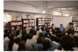
【本屋：Book】×【お酒：Beer】 概要：「これからの街の本屋」を目指し、人と人が出あえる場づくり。 365日毎晩トークイベントなどを開催。お酒も飲める。