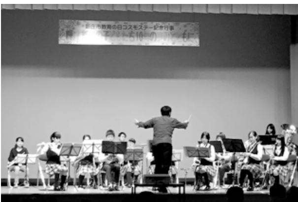
▲11/12「新庄市教育の日」でのステージ