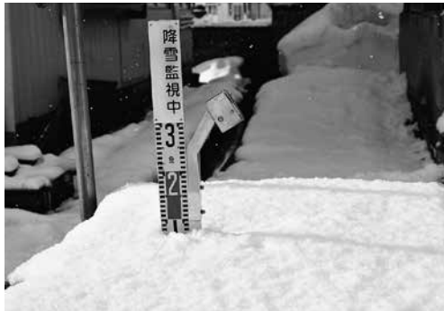
▲市内三カ所に設置された「除雪自動通報装置」。降雪量10cmを観測すると、対応した地区に除雪車出動命令がでる。

道路の除雪は、基本的に市内の建設業者などに作業を委託しています。前述の条件に基づいて出動が決定すると、各社へ一斉に連絡が行き、除雪作業に取り掛かります。今年は37社と委託契約を結び、降雪に備えています。また、路面に吹きだまりやわだちができた場合や、積雪で道幅が狭くなったたりした場合などにも出動することにして