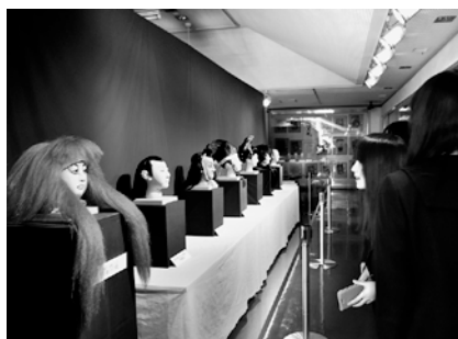
▲1月30日まで開催中の「新庄まつりの山車行事展」。