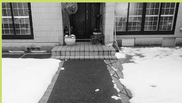
▲融雪マットを設置すると玄関先の凍結を防げます