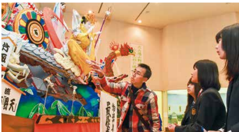
▲どういった考えのもと山車制作をおこなっているのかなど、解説いただきました

子どもの頃からまつりに継続的に参加できることが、文化の継承にはとても重要なことのように感じました。