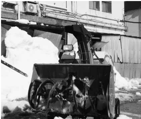
▲貸し出している除雪機は小型です