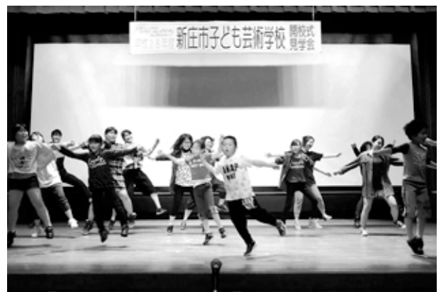
▲5/15「子ども芸術学校・開講式」での様子