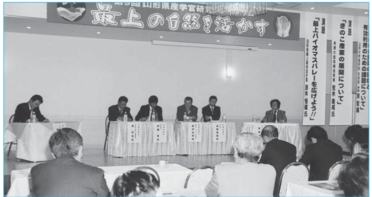
▲バイオマスの取り組みや最上の自然を生かした潜在力について話し合った産学官研究シンポジウム(11月16日／ニュグランドホテル)