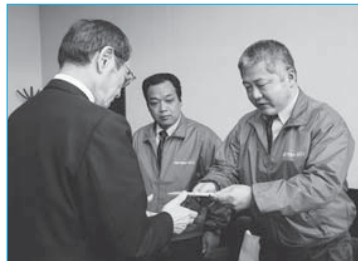
▲駅前通り商店会が市に寄付(11月22日/市役所)