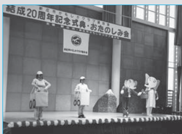
⑭かもしかクラブ連合会が結成20周年