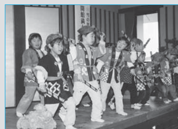
⑬記念式典で踊りを披露