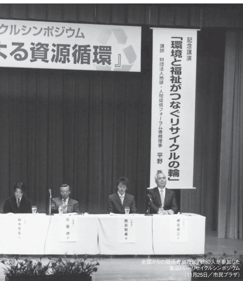
全国からの関係者や市民約380人が参加した食品トレーリサイクルシンポジウム (11月25日/市民プラザ)

市民・福祉施設・企業が協力し合い、食品トレーを資源として再利用することで、地球規模の環境汚染に歯止めをかけようという取り組みが新庄市で始まりました。この取り組みを食品トレーの利用者である市民の皆さんに紹介し、環境保全と障害者の社会参加について考えるためシンポジウムを開催しました。