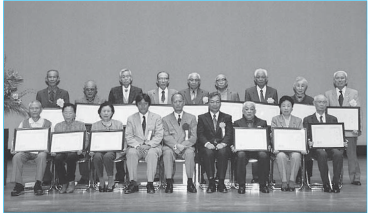
▲「むし歯サミット in 新庄」で表彰された歯の長寿者(11月8日／市民プラザ)