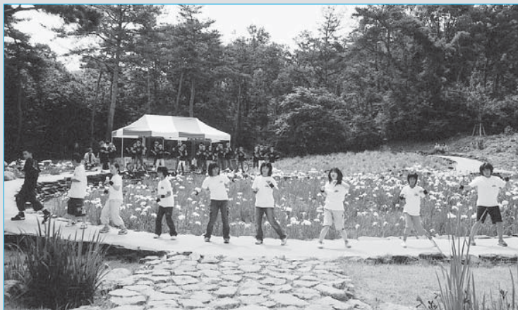
⑦「あじさいを育てる会」が企画・運営した「あじさいまつり」