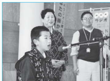
▲NHKラジオ全国生中継で新庄をPR(11月5日/ゆめりあ)