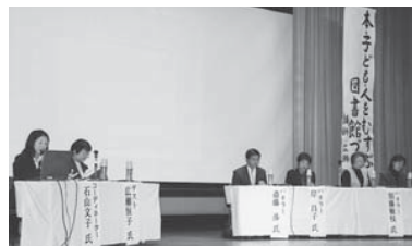
▲パネルディスカッション(11月18日/市民プラザ)

講演終了後、新庄・最上地区内の学校での朝読書の取り組みやボランティアによる読み聞かせの状況などのアンケート結果をもとに「本好きの子どもを増やそう」というテーマでパネルディスカッションが行われました。