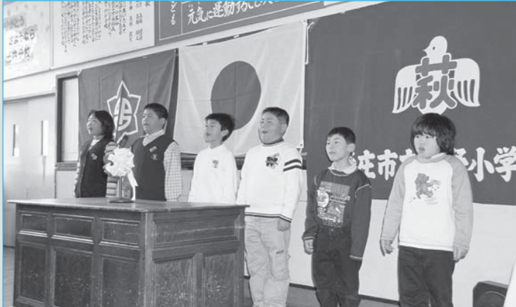
③約130人が集まった閉校式で「土内分校の歌」を合唱する児童