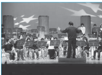
▲結成2年目のジュニア部も演奏した新庄吹奏楽団定期演奏会(11月7日/市民文化会館)