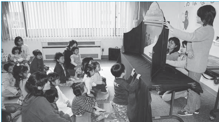
▲多くの人が楽しんだ「としょかんまつり」(11月6日～7日/市立図書館)