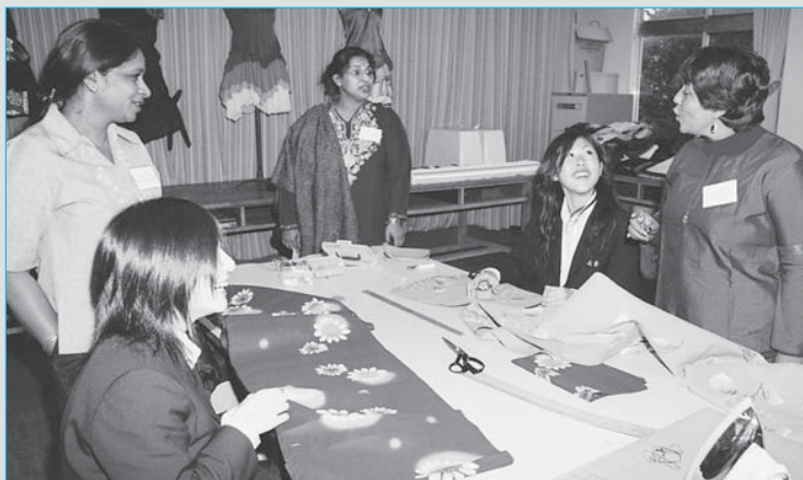
⑫世界11カ国から20人の教員が新庄南高などを視察