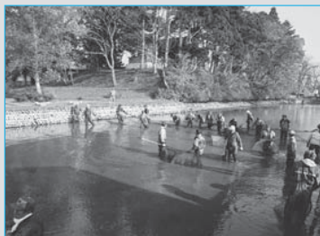
⑪最上公園の堀を一斉清掃