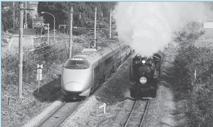
⑨山形新幹線新庄延伸以来5年ぶりに並走した山形新幹線「つばさ」と「SL義経号」

①豪雪期の水不足解消に向け、最上川から取水し市街地の流雪溝へ流す「消流雪用水事業」の試験通水を実施(1月15日～2月6日)