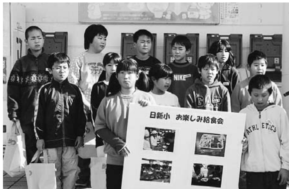
はがせる容器の感想を述べる子どもたち(11月23日)

「山車づくりの魅力や夢中にさせるものって何々だろう」「職業を越えて同じになれる、人とのつながりかな」「小若と囃子方、若衆と一つになれること」「地域・町内の協力のあたたかさもある」「初めて参加した時の感動。鳥はだ立ったよな」