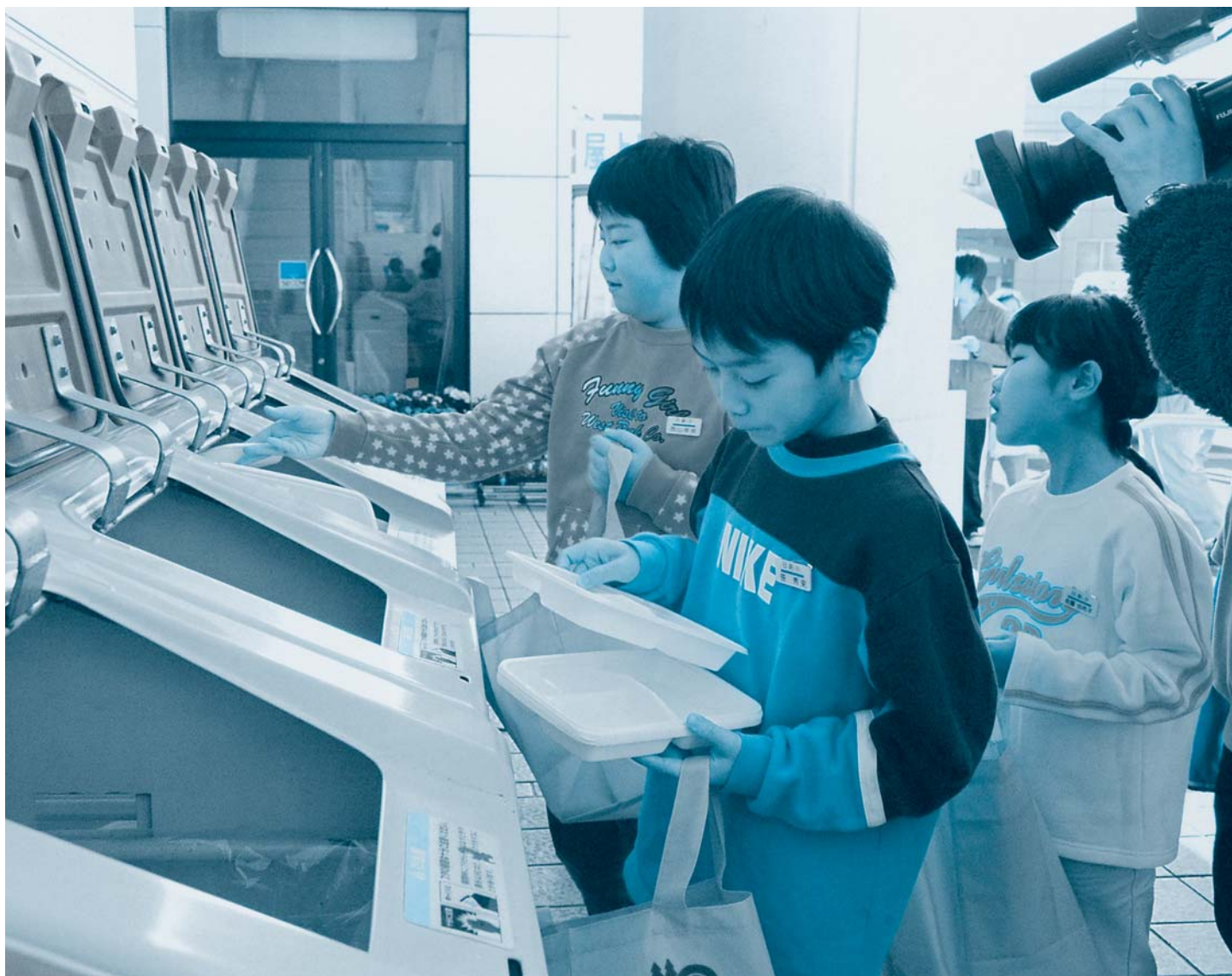
食品トレーを回収箱へ(11月23日/郷野目ストア)