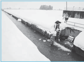
①「消流雪用水事業」の試験通水