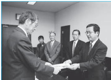
▲あじさいを育てる会がプリンターを寄贈(11月2日/市役所)