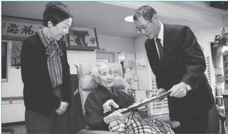
▲長寿100歳のお祝い会(11月8日/新寿荘)