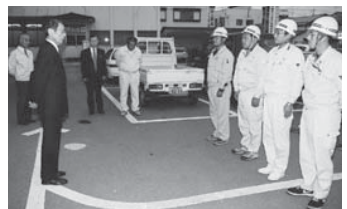
▲新潟県中越地震の支援活動に職員4名 を派遣

新潟県中越地震の被災者に対 し、これまで市の窓口で503,000円 の義援金が寄せられています(11月 末現在)。ご協力ありがとうございます。 今後ともご協力をお願いします。 ○新潟県中越地震 12月28日(火)まで ○受付場所 市役所市民相談室また は日赤新庄市地区(大手会館内) ◎詳しくは、市役所市民相談室 ☎内線 125、日赤新庄市地区 ☎22-5797へ。