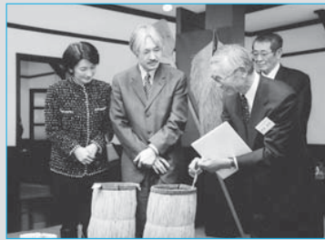
②秋篠宮ご夫妻が雪の里情報館をご見学