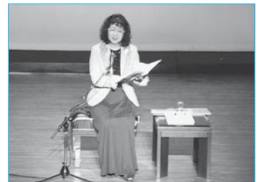
▲声優・小原乃梨子さんが講師を務めた「バルボンの公開講座」(11月13日／市民プラザ)