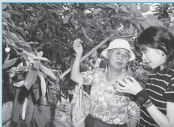
⑥観光客でにぎわう観光サクラボ園