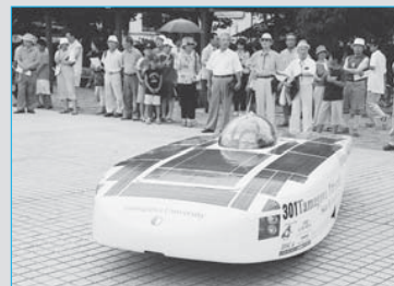
⑩ハイブリッドソーラーカーがデモ走行