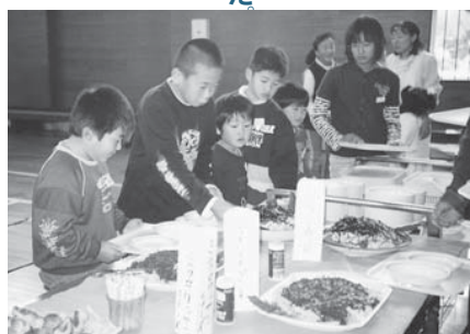
▲バイキング形式の給食(北辰小)

は、十四年度をピークに減少傾向に転じています。また、以前に比べ、授業中の子どもも落ち着きを取り戻しています。このことからこれまで紹介してきた学校や地域の取り組みの成果が着実に現れてきているといえます。